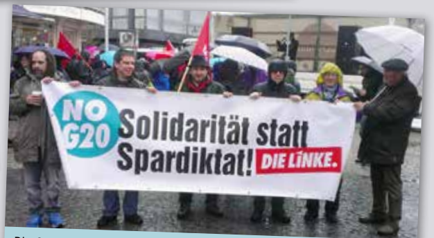
Die G20 kommen, wir sind schon da: Im März protestierte DIE LINKE mit anderen Aktiven gegen das Treffen der Finanzminister in Baden-Baden