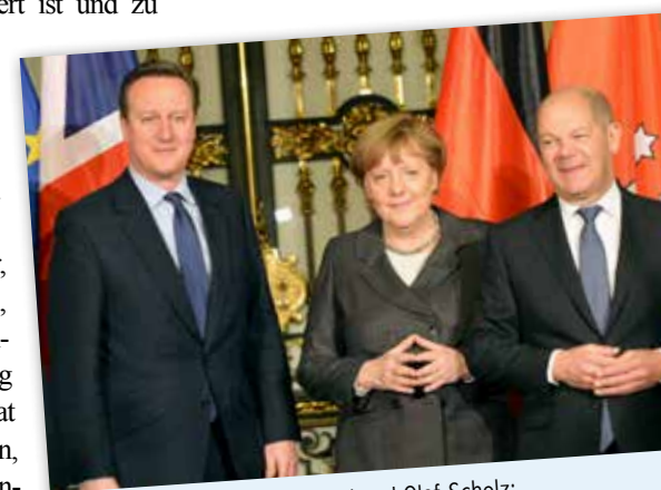
David Cameron, Angela Merkel und Olaf Scholz: Die Entscheidung über den Gipfel machten sie unter sich aus

Auch das Volk wurde nicht befragt. Hatte Scholz sich zuvor bei der Entscheidung über Olympia noch als Superdemokrat inszeniert, der weitreichende Entscheidung für die Stadt nicht am Volk vorbei trifft, entschied er über G20 wie ein König und stellte alle vor vollendete Tatsachen. Apropos Olympia: Wie man im Rathaus munkt, ist der G20-Gipfel in Hamburg noch eine Spätfolge von Hamburgs Olympia-Bewerbung. Ein international beachtetes Großereignis in der Hansestadt sollte kurz vor der Entscheidung des IOC über den Austragungsort der Bewerbung noch mal einen kräftigen Schub geben, so die Idee der Feuer-und-Flamme-Fans. Olympia konnte durch das Referendum bekanntlich verhindert werden. G20 nicht.